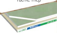
Tấm Thạch Cao SIÊU CHỊU ẨM VĨNH TƯỜNG-gyproc