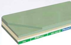
Tấm Thạch Cao VĨNH TƯỜNG-gyproc SIÊU CHỊU ẨM PROMAX